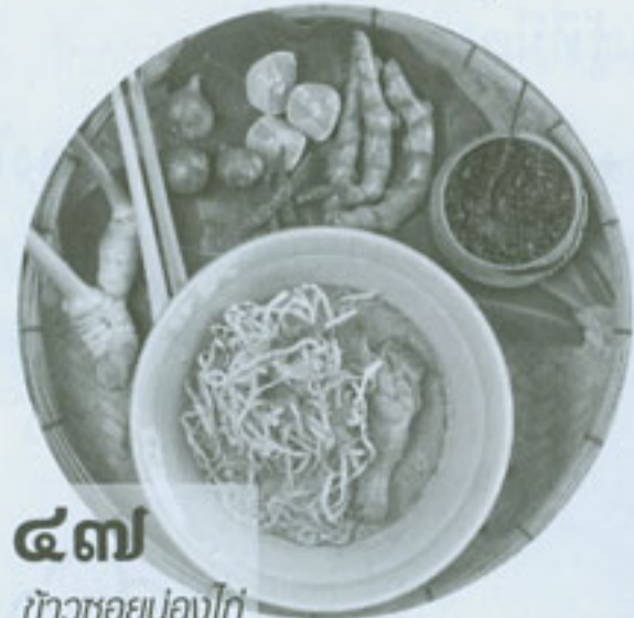
๔๗ ข้าวซอยน่องไก่