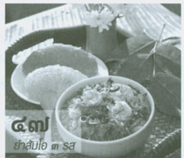
๔๗ ยำส้มโอ ๓ สส